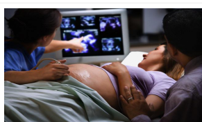
Flop del test di screening in gravidanza, tanti i risultati