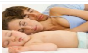
Il sonno dei piccoli: dormire con i genitori lo disturba