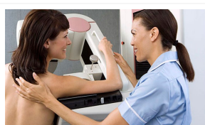
Mammografia: pesanti critiche sulla sovradiagnosi